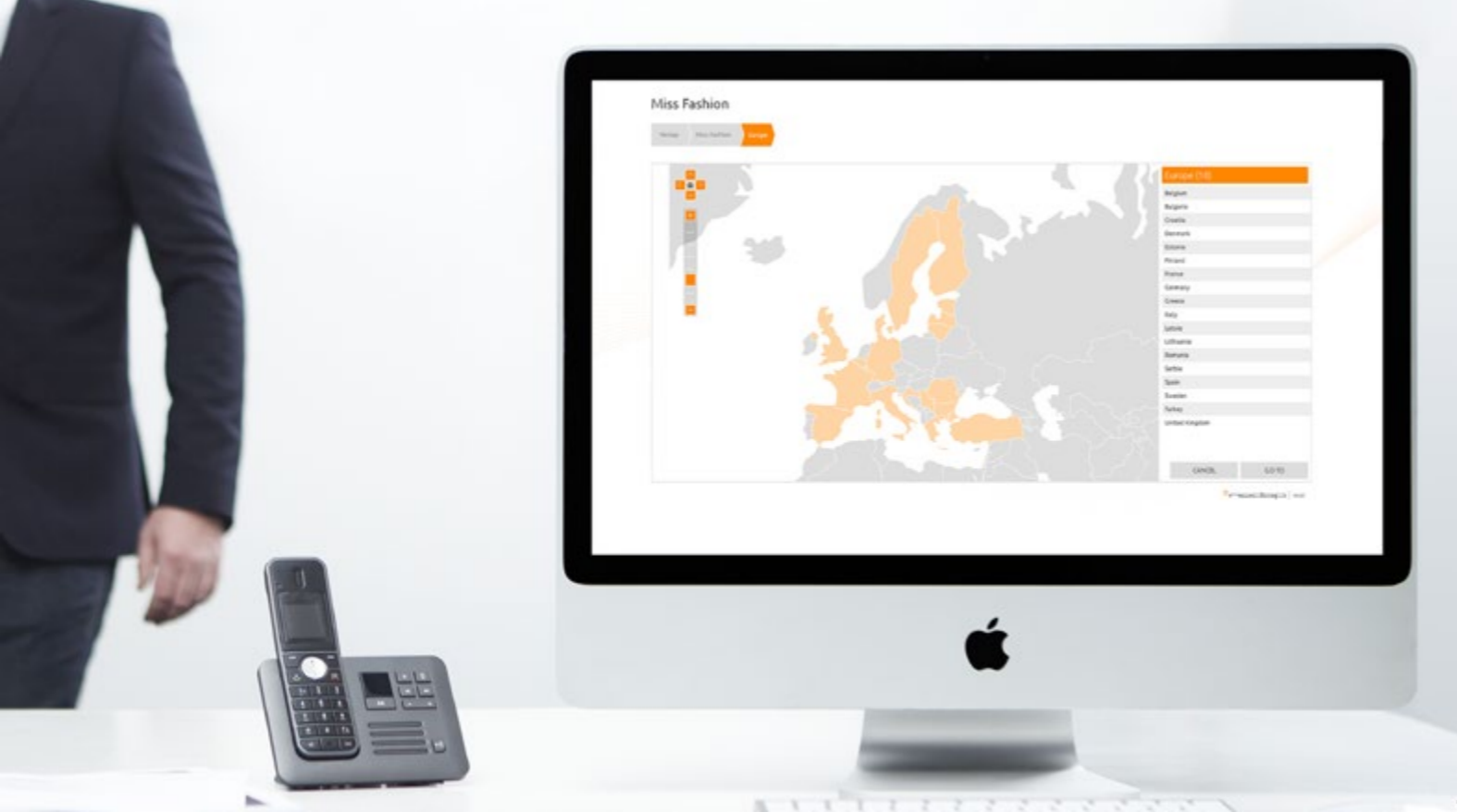
Plate-forme Web Retail Analytics

Pour obtenir plus de détails sur certains points, vous pouvez aussi accéder à vos données sur la plate-forme Web Retail Analytics. Les informations détaillées sur le comportement des membres du personnel, des clients et des systèmes facilitent la gestion de votre groupement d'enseigne de distribution puisque que vous savez exactement ce qui se passe dans vos magasins. Vous pouvez ainsi traiter les menaces de sécurité et augmenter votre rentabilité de manière plus rapide et plus précise.